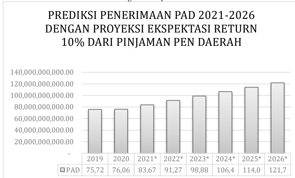
Gambar 3. target Pendapatan Asli Daerah