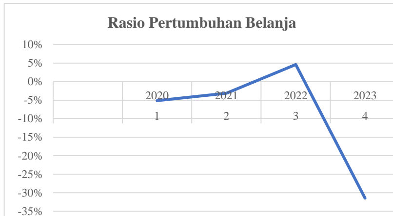
Gambar 3. Rasio Pertumbuhan Belanja Desa Lambangan Tahun 2020-2023