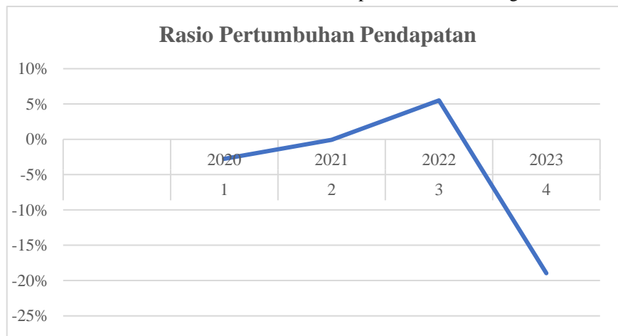
Gambar 2. Grafik Rasio Pertumbuhan Pendapatan Desa Lambangan 2020-2023